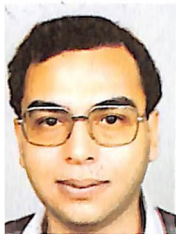
د. أحمد خالد توفيق